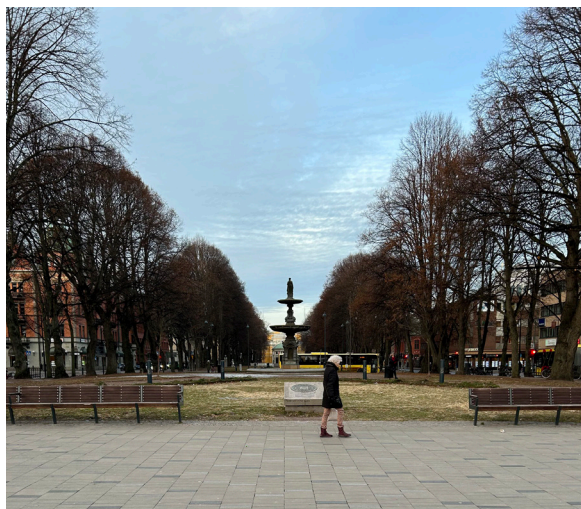
Bild: Gävlebockens plats år 2022

Självklart så får vi inte glömma lillebror bock, som årligen byggs av Vasaskolans gymnasieelever. År 2022 ser vi även att lillebror har växt, från fyra meter till hela sju meter hög.